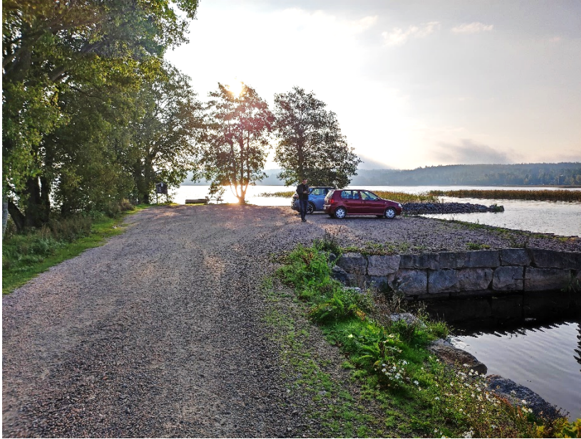
Piren med vändplan