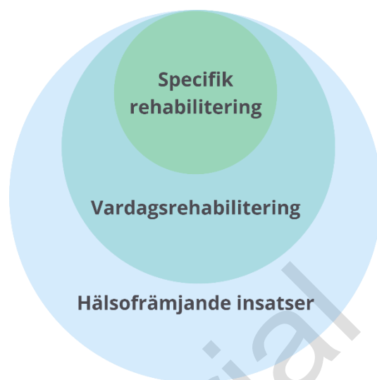
Figur 3 Rehabiliteringsdomäner

Rehabilitering sker inom flera domäner, figur 3. Nedan definieras vad som avses med de olika rehabiliteringsdomänerna.