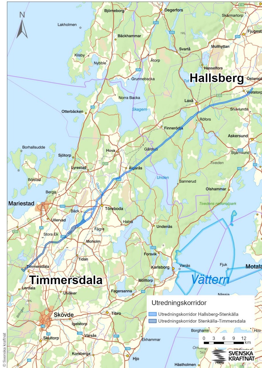
Figur 1 Översiktskarta över de fem utbyggnadsförslagen från Hallsberg, via Stenkälla till Timmersdala.