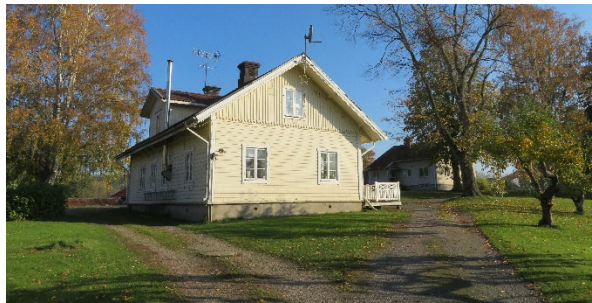
Dessa båda bostadshus ligger inom det planlagda industriområdet men utanför denna ändringsplan (ÄDP).

Inom den nordligaste delen av industriområdet har det efter att glasbruket lades ner 1992 inte förekommit någon tyngre industriverksamhet. Verksamheterna har huvudsakligen utgjorts av lagerhållning och kontor för de aktiva företagen inom området. Under en period nyttjades flera byggnader av Försvarmakten för lagerhållning. En mindre mekanisk verkstad finns kvar, liksom en småskalig betongtillverkning. Samma fastighetsägare som ansökt om planbesked för bostadsutveckling ägde även den norra delen av industriområdet när planläggningen påbörjades, därefter har två fastigheter med industribyggnader avyttrats under pågående planprocess.