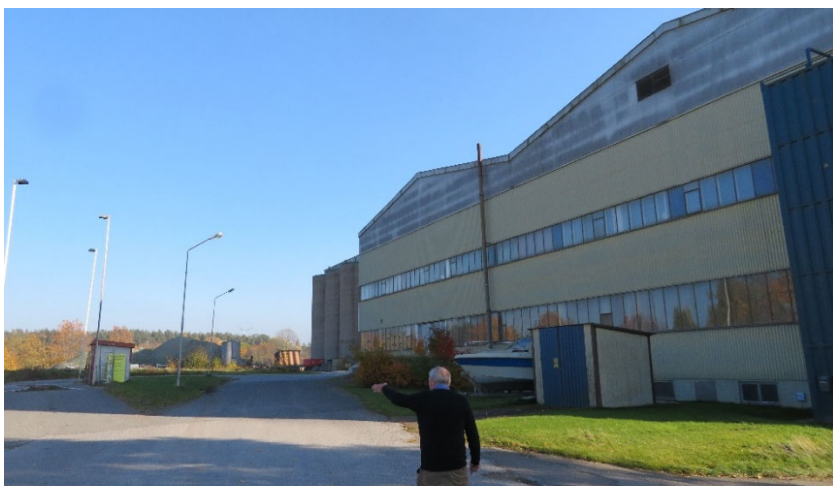
Den här lager- och kontorsbyggnaden samt de silos som skymtar bakom densamma ingår i den nu aktuella ändringsplanen (ÄDP).

Norr om industriområdet finns två bostadshus inklusive några uthus som ursprungligen hörde till industrin, en disponentvilla och ett äldre bostadshus. Därtill en byggnad som längre tillbaka i tiden innehöll en mindre matvarubutik men därefter bland annat fungerat som föreningslokal (Strandgården). För närvarande används byggnaden av fastighetsägaren som ett tillfälligt kontor. I nordvästra delen av det planlagda industriområdet finns även en äldre personalparkeringsyta som idag delvis används som upplag men som även är tillfart till ovan nämnda föreningslokal samt en allmän iläggingsramp och några båthus längs stranden.