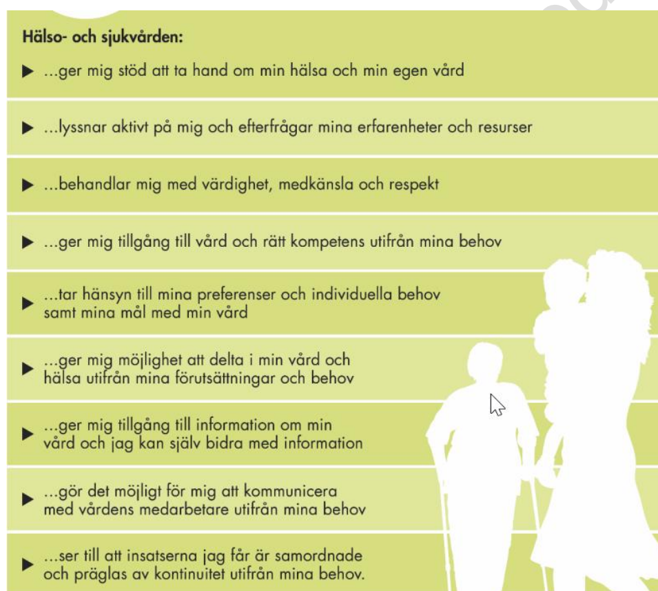
Figur 2.