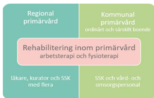
Figur 1: Ansvarsfördelning för primärvård i Örebro län

Ansvaret för rehabilitering på primärvårdsnivå reglerades genom att alla arbetsterapeuter anställdes i kommunerna och alla fysioterapeuter anställdes i Regionen. Båda professionerna har ett vårdgivaransvar och riktat uppdrag gentemot både kommun och Region. Rehabiliteringsprofessionerna har ett gemensamt ansvar för en sammanhållen rehabiliteringskedja i primärvården. Förutsättningar och krav på parterna finns i strategi för rehabilitering.