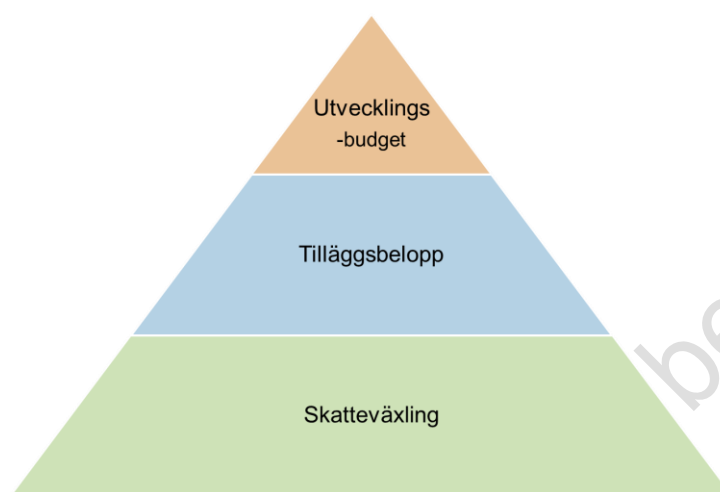
Figur 5. Modell för ekonomisk reglering mellan kommun och region

Den ekonomiska modellen baseras på samma grunder som tidigare använts med skatteväxling och tilläggsbelopp. Skatteväxlingen är oförändrad medan tilläggsbelopp uppdateras och utökas jämfört med tidigare överenskommelse. Specifika satsningar hanteras i utvecklingsbudget.