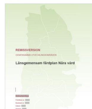
Del 3. Gemensamma utvecklingsområden (Färdplan Nära vård)