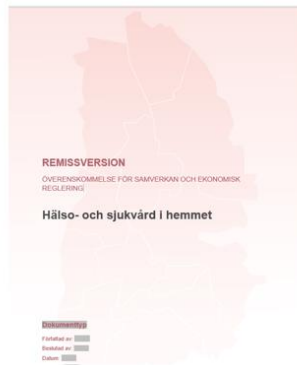
Del 1. Ramverk Principerna för samverkan och ekonomisk reglering

Del 3. Plan för gemensamma utvecklingsområden