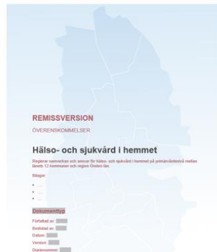
Del 2. Överenskommelserna En bilaga/område med hänvisning till processförloppet