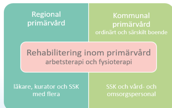
Figur 1 Professioner inom primärvård