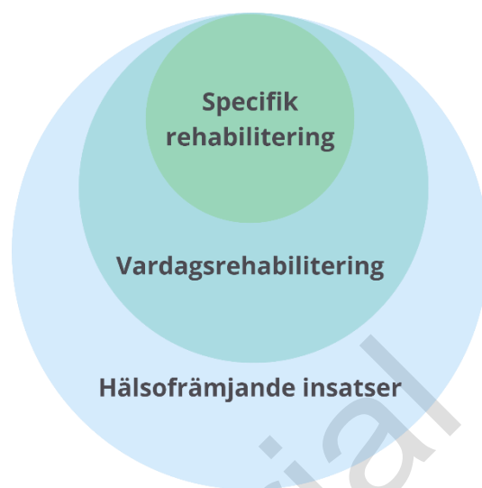
Figur 3 Rehabiliteringsdomäner

Rehabilitering sker inom flera domäner, figur 3. Nedan definieras vad som avses med de olika rehabiliteringsdomänerna.